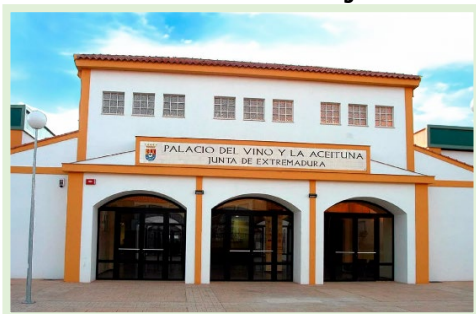
Palacio del Vino Calle Juan Campomanes, 2 06200, Almendralejo (Badajoz)