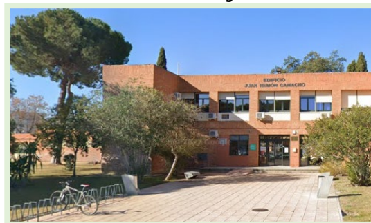
Edificio Juan Remón Camacho (Antiguo Rectorado) Avda. Elvas, s/n 06006 Badajoz