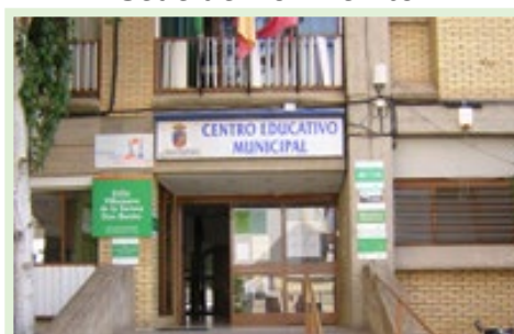
Centro Educativo Municipal C/San Juan, 3 06400, Don Benito (Badajoz)