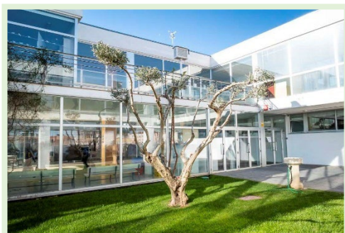
IES Puerta de la Serena C/Antonio de Nebrija, 8 06700, Villanueva de la Serena (Badajoz)