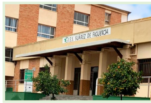
Instituto de Educación Secundaria "Suárez de Figueroa" Avda. de la Fuente, s/n 06300, Zafra (Badajoz)