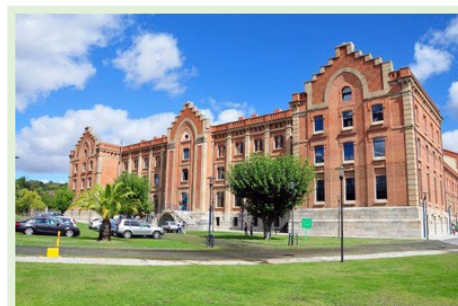
Centro Universitario de Plasencia. Avda. Virgen del Puerto, s/n 10600, Plasencia (Cáceres)