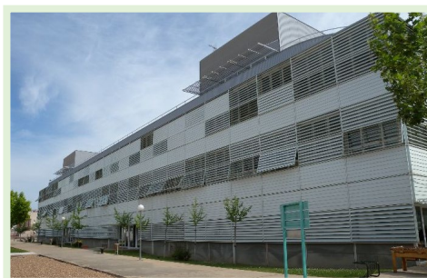
Centro Universitario de Mérida Avda. Santa Teresa de Jornet, s/n 06800, Mérida (Badajoz)